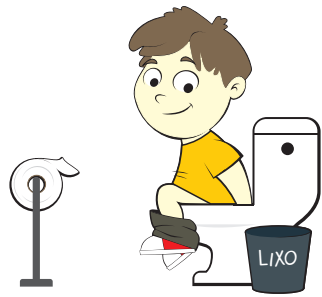
Limpar o corpo com o papel