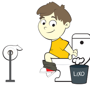
Jogar fora o papel higiênico