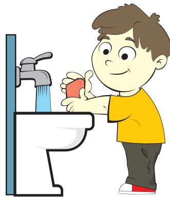
Lavar as mãos com água e sabão