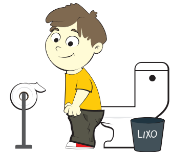
Colocar as roupas para cima