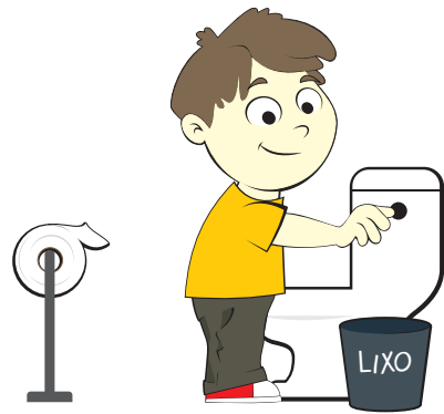
Dar a descarga no vaso sanitário