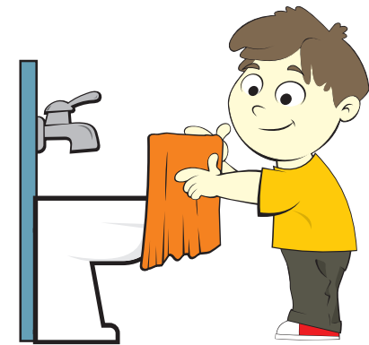
Secar as mãos