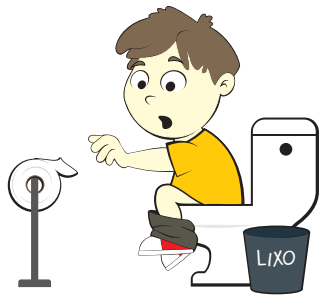
Pegar o papel higiênico